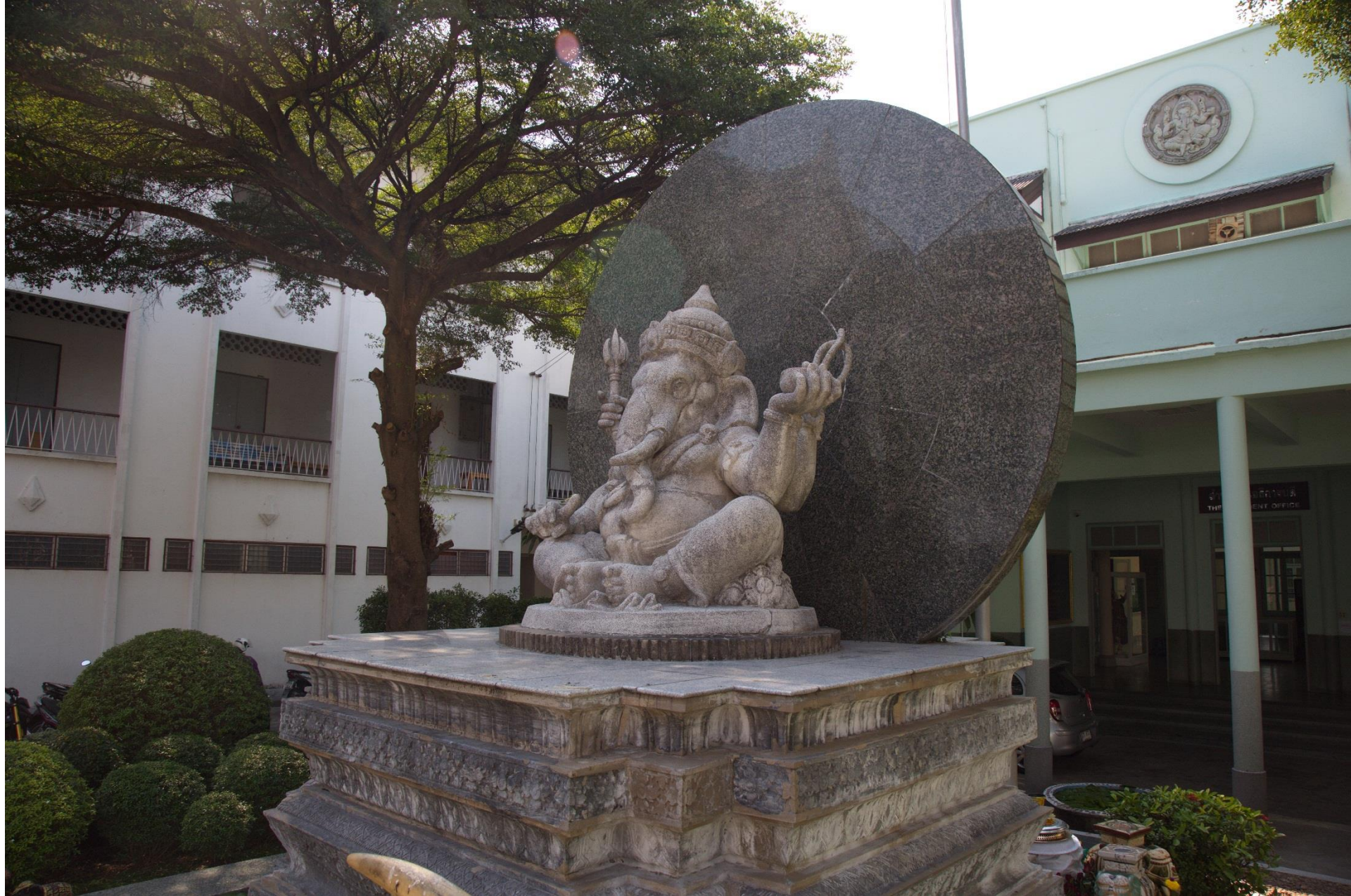
พระคเณศ ที่สถาบันบัณฑิตพัฒนศิลป์ ปั้นเมื่อ พ.ศ. ๒๔๗๗