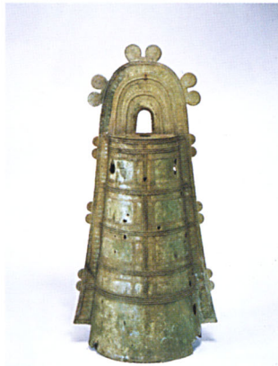
ระฆังโตตากู ปลายสมัยยาโยอิ พุทธศตวรรษที่ ๗ - ๘ พิพิธภัณฑสถานแห่งชาติ ควิซุ ญี่ปุ่น