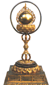
สถูปจำลองทรงเปลวไฟ สำริด กะไหล่ทอง แก้วผลึก พุทธศตวรรษที่ ๑๘ - ๒๐ พิพิธภัณฑสถานแห่งชาติ โตเกียว ญี่ปุ่น