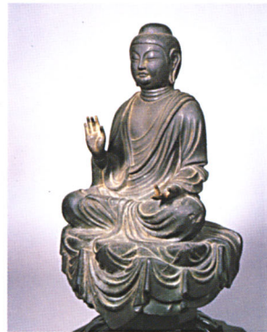
พระไภษัชยคุรุ สำริด พุทธศตวรรษที่ ๑๓ - ๑๔ พิพิธภัณฑสถานแห่งชาติ นารา ญี่ปุ่น