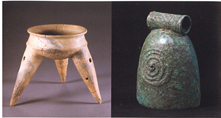
หม้อสามขา

การรับวัฒนธรรมต่างแดนจากแหล่งที่มาเดียวกันคือ จีนและอินเดีย ลัทธิศาสนาที่พัฒนาขึ้นพร้อมกับรูปแบบศิลปกรรมของสองแหล่งต้นกำเนิดนี้ ให้อิทธิพลสำคัญต่อการสร้างสรรค์วัฒนธรรมสมัยประวัติศาสตร์ของไทยและญี่ปุ่น รูปเคารพ สัญลักษณ์และสิ่งประกอบในลัทธิศาสนา ไม่ว่าจะเป็นฮินดู พระพุทธศาสนา ดันตระ สะท้อนสุนทรียภาพที่อยู่บนความเชื่อซึ่งเลือกรับและปรับให้เข้ากับวิถีชีวิตและสังคม