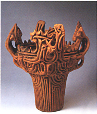
เครื่องปั้นดินเผาทรงเปลวไฟ สมัยโจมน ๑,๕๐๐ ปีก่อน พุทธกาล เมืองซีหนัน จ.นีกะตะ ญี่ปุ่น