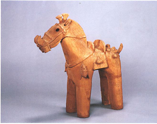
ตุ๊กตาดินเผาฮานิวะรูปม้า สมัยโคฟีน พุทธศตวรรษที่ ๑๑ - ๑๒ พิพิธภัณฑสถานแห่งชาติควิซุ ญี่ปุ่น