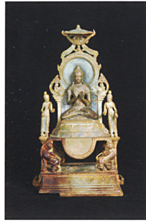
พระไวโรจนะ สำริด โกสุมพิสัย มหาสารคาม พุทธศตวรรษที่ ๑๔ - ๑๕ พิพิธภัณฑสถานแห่งชาติ พระนครศรี