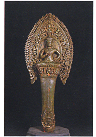
งอนคานหามสำริด รูปพระวัชรสัตตวะ พุทธศตวรรษที่ ๑๘ พิพิธภัณฑสถานแห่งชาติ พระนครศรี