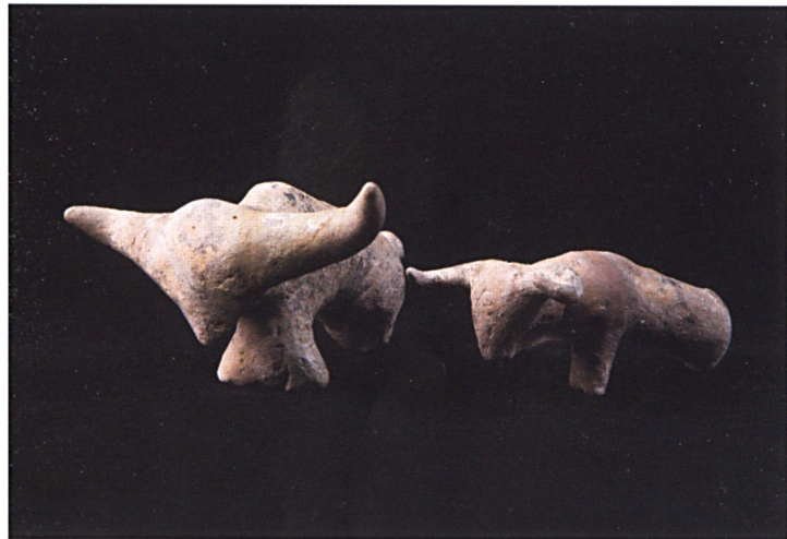
ตุ๊กตาดินเผารูปวัว

วัดโพธิ์ศรีใน อุดรธานี ๒,๓๐๐ - ๑,๘๐๐ ปีมาแล้ว